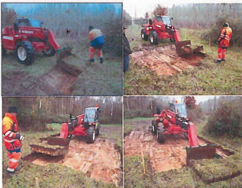
Exemple de découpages et prélèvements successifs par plaques de végétation