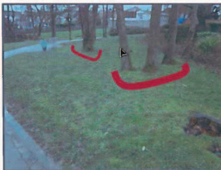
Implantation des Tulipes des bois au pied des arbres