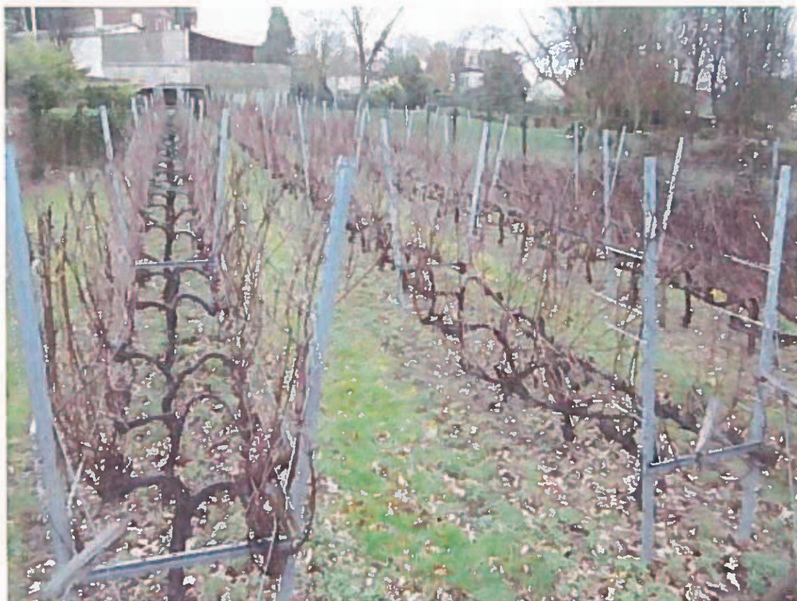
La vigne située à l'Ouest du Parc