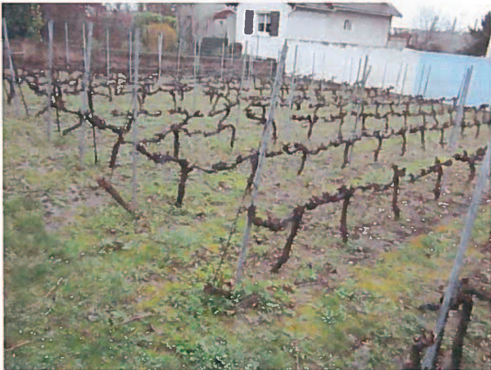
La vigne située à l'Est du parc