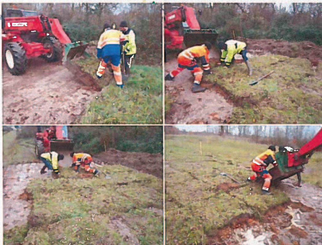
Remise en place des plaques de végétation